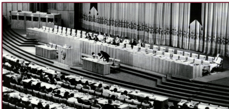
_Fig. 1 - Conferência de Alma-Ata, na antiga União Soviética, Organização Mundial da Saúde, 1978.

Definiram-se, também, os elementos essenciais da APS para aquele momento histórico, como apontado anteriormente, sendo muitos deles similares aos dos centros de saúde comunitários: educação em saúde conforme as necessidades locais; pro-