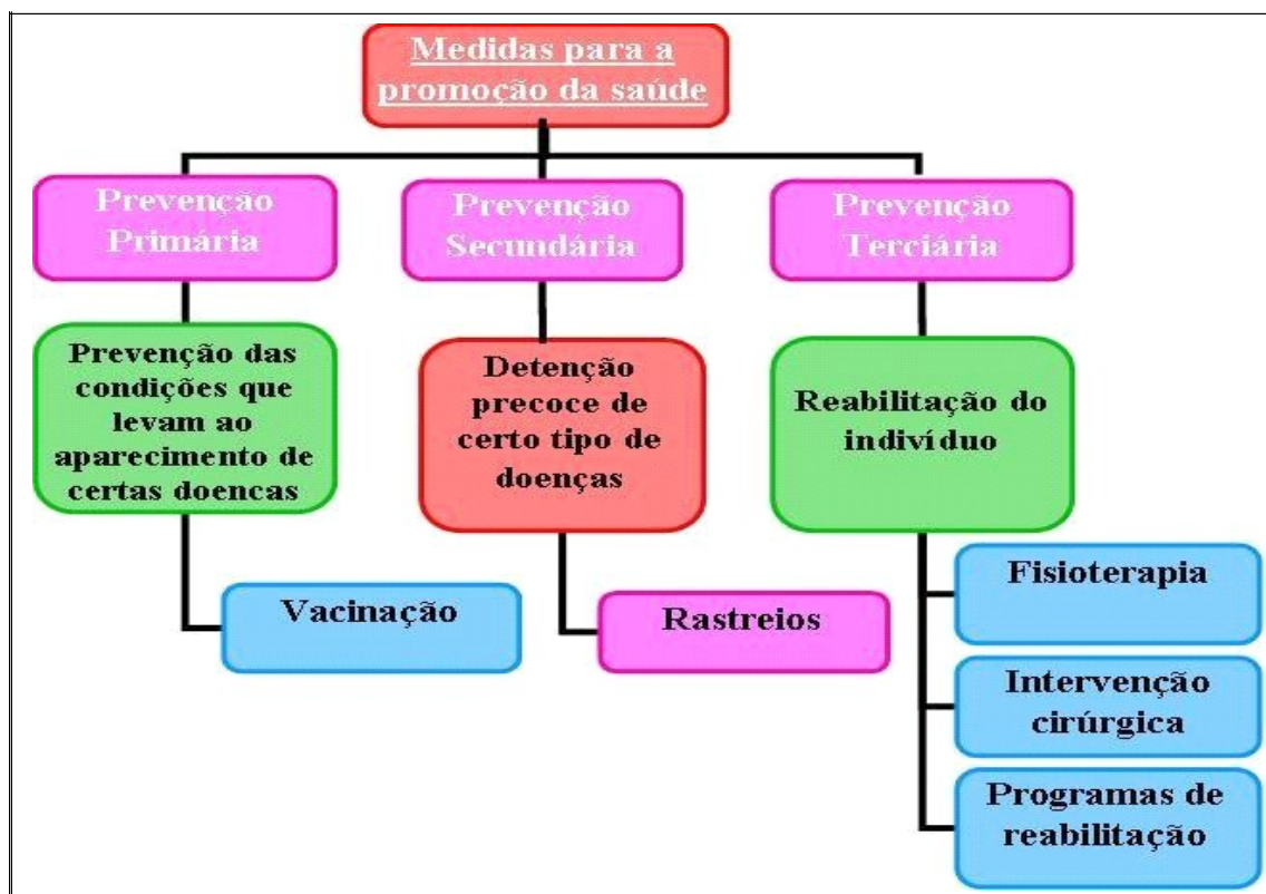
Figura 3 - Medidas para promoção da saúde