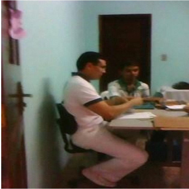
Figura 1 - Enfermeiro do Caps, visita realizada em dos trabalhos em campo