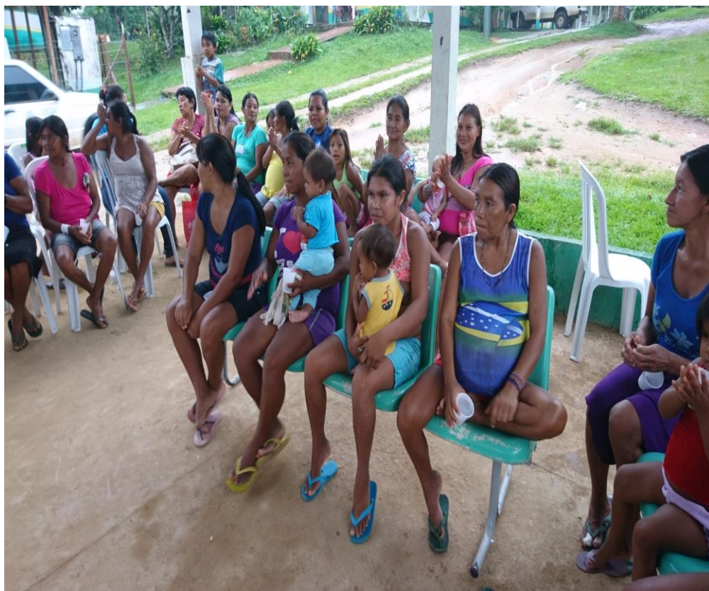
Foto 06. Palestras Educativas com as mulheres indígenas.