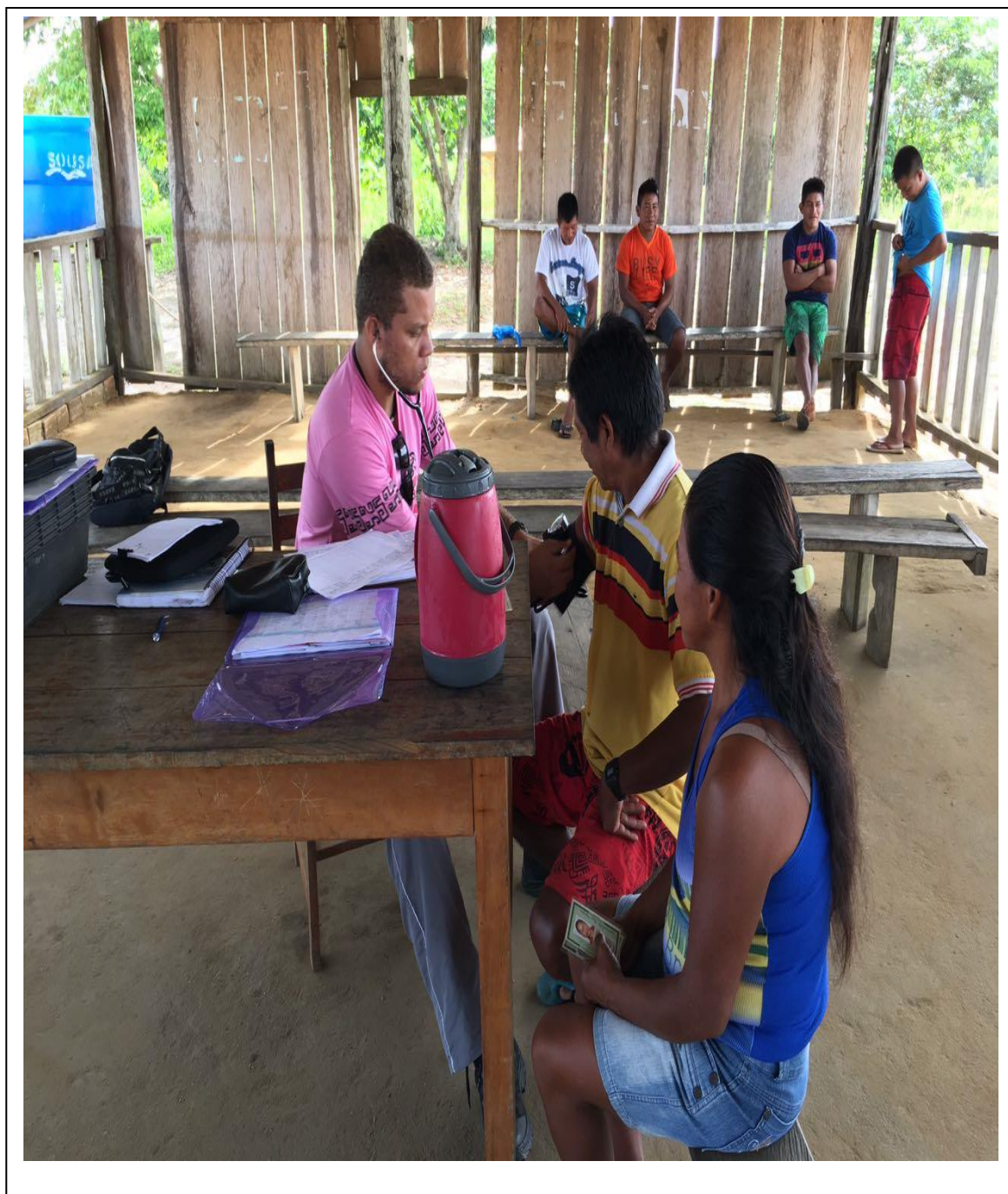
Foto 02. Consulta casal da etnia Desana e Tukano.