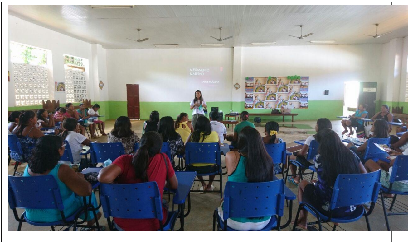
Foto 01. Palestras com as mulheres do polo base Yauaretê sobre Planejamento familiar.