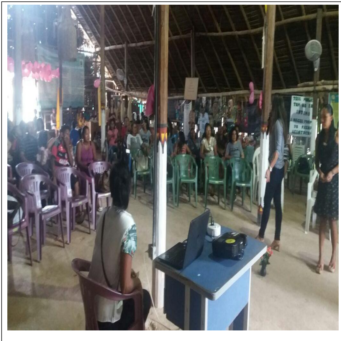
Foto 03. Palestra com as mulheres indígenas na Maloca FOIRN SGC sobre saúde da mulher indígena.