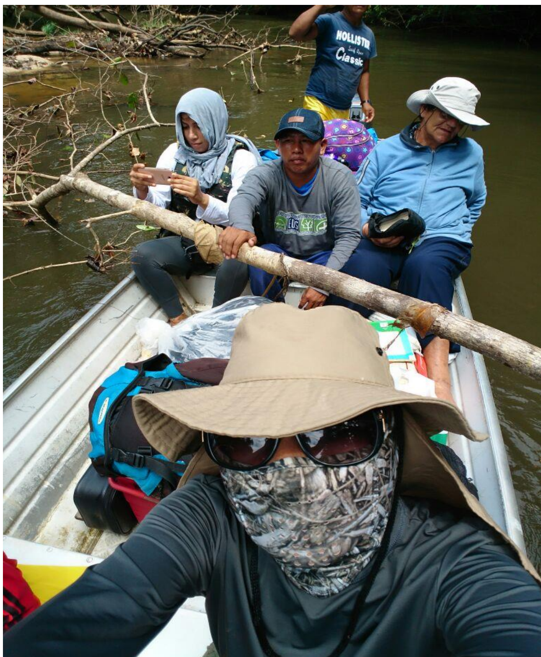
Foto 07. Dificuldades de acesso ao Polo Base Yauaretê