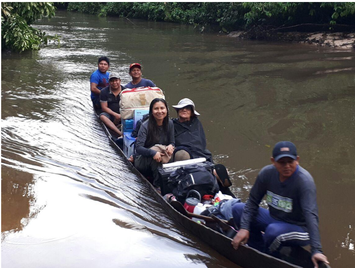
Foto 05. Acesso ao local de trabalho pela equipe a multidisciplinar.