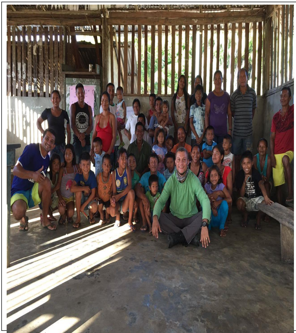
Foto 04. Famílias indígenas - Palestras Educativas.