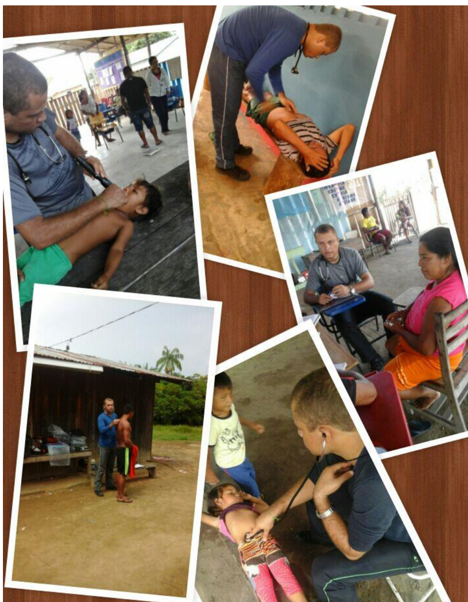
Foto 08. Atenção à saúde indígena