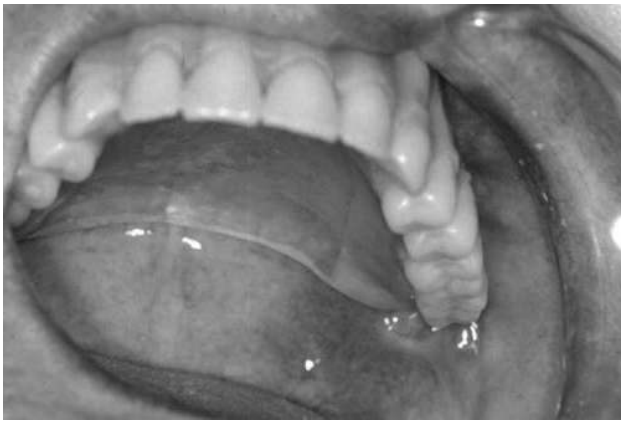
Figura 1- Prótese total superior mal adaptada.

Motivam seu emprego na reabilitação do paciente, visando estética, função, fonética e conforto, podem, devido à instalação de próteses mal adaptadas (Figuras 1 e 2) e a falta de orientação do paciente, afetar de forma adversa o prognóstico final do tratamento, com o aparecimento, por exemplo, de lesões orais.