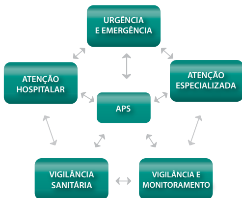
Figura 1 - Organização poliárquica da rede.