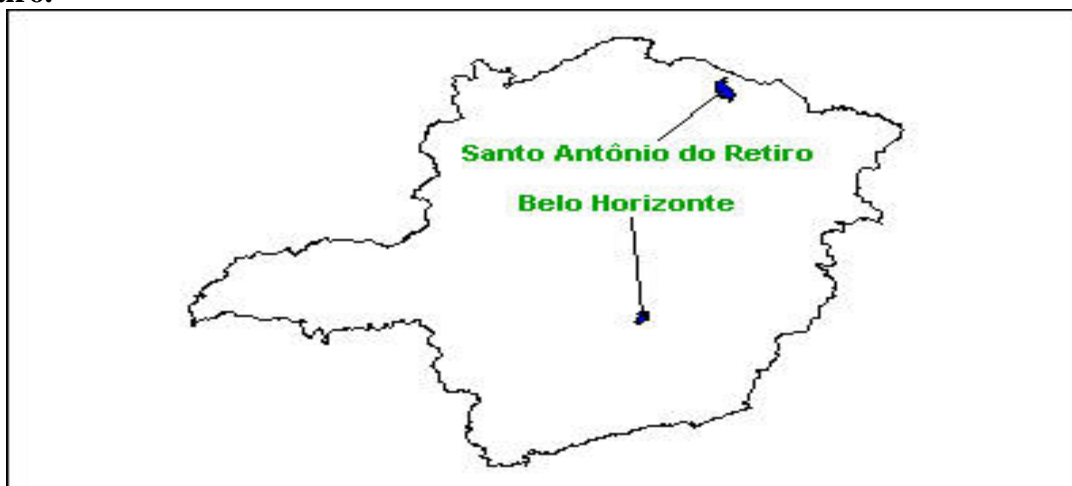
Figura 1- Mapa de Minas Gerais e Localização do município de Santo Antônio do Retiro.