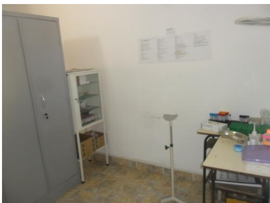
Figura 6 – Sala de coleta