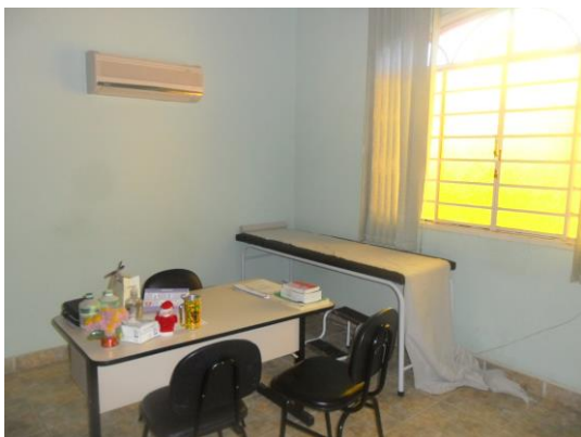
Figura 4 – Consultório clínico