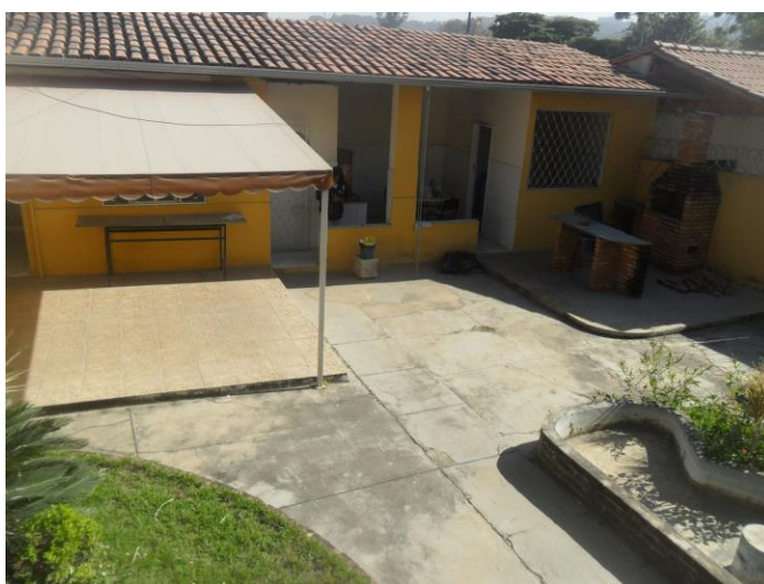
Figura 8 – Quintal do ESF Célia II

As atividades desempenhadas pela equipe são: agendamento de consultas e exames, vacinação, consultas médicas (demanda espontânea e agenda programada), visita domiciliar, pré-natal, puericultura, grupos operativos (HAS, DM, Gestantes, Idosos), palestras educativas e grupos de atividade física. Os grupos de atividade física são realizados, normalmente, no quintal da casa (Figura 8).