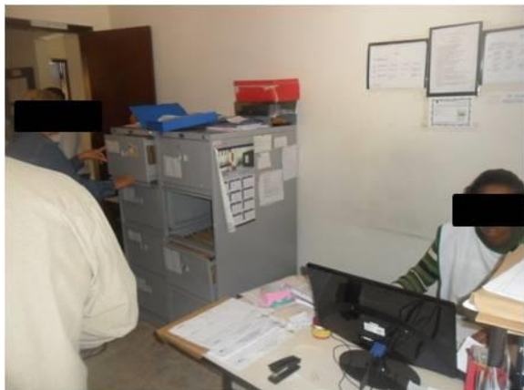
Figura 2 - Recepção

As figuras dois a sete ilustram os ambientes internos da Unidade Básica de Saúde, ESF Célia II.