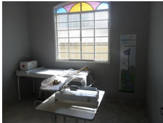
Figura 3 – Consultório pediátrico