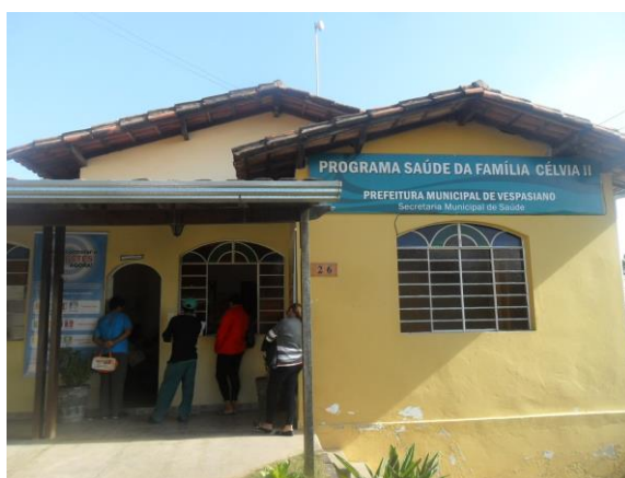
Figura 1- Unidade Básica de Saúde ESF Célvia II.

A Unidade Básica de Saúde, ESF Célvia II, está instalada em imóvel residencial, alugado (Figura 1) e adaptado para o funcionamento da atual unidade conforme tabela 1. É possível verificar a inexistência de adaptações para pessoas com deficiência física como: sanitário adaptado, barras de apoio, corrimão, rampas de acesso, piso antiderrapante, balcão e bebedouros mais baixos para cadeirantes. A largura das portas e corredor de circulação não apresentam medidas compatíveis com a circulação de usuários cadeirantes, etc.