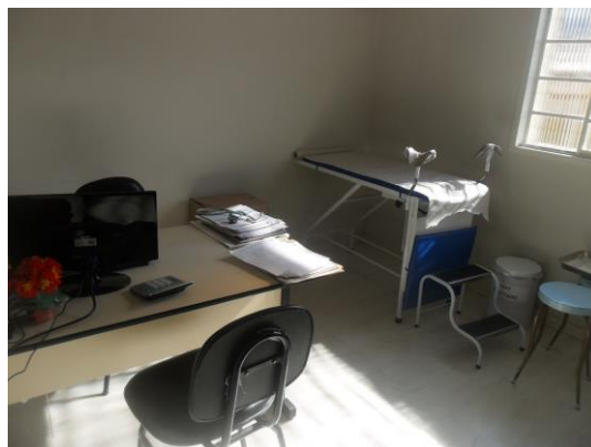
Figura 5 – Consultório de enfermagem