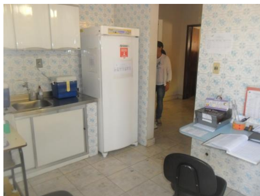
Figura 7 – Sala de vacina