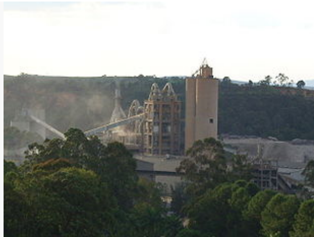
FIGURA 2- Fabrica de cimento Holcim Brasil S.A. em Barroso

Imagem postada no Jornal local Barroso em Dia-Ag.;2014