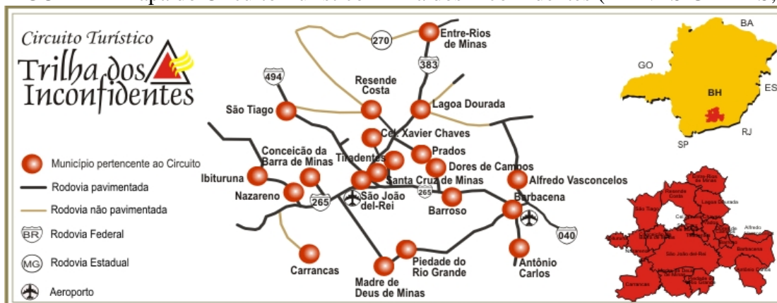
FIGURA 1- Mapa do Circuito Turístico Trilha dos Inconfidentes ( MINAS GERAIS, 2011)