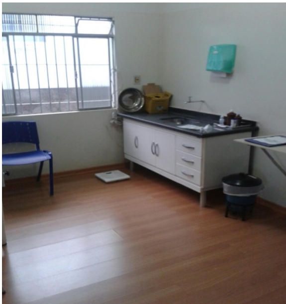
SALA DE CURATIVOS