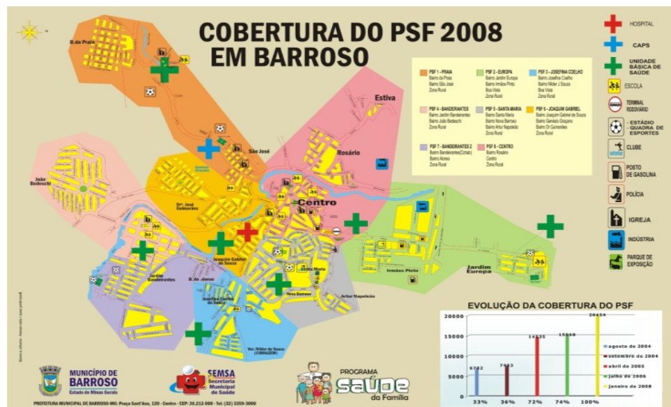
FIGURA 3- Mapeamento das Estratégias de Saúde da Família de Barroso-MG