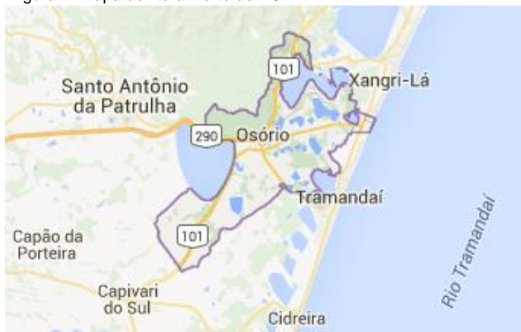
Figura 1- Mapa do litoral norte do RS