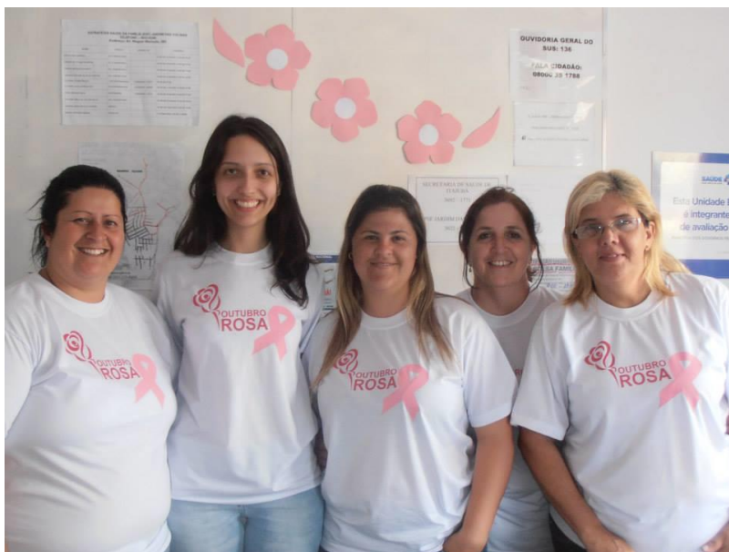
Figura 3: Campanha Outubro Rosa

Observou-se que foi grande a procura de mulheres pela mamografia, mas poucas foram realizar preventivo. Esperava-se realizar cerca de oito preventivos por dia em uma semana. Mas, destas quarenta mulheres esperadas, apenas vinte procuraram a unidade. Naquele mês de outubro, havia vinte e cinco resultados de preventivos prontos e arquivados, mas apenas duas mulheres compareceram para pegar o resultado e receber orientações e tratamento quando necessário.