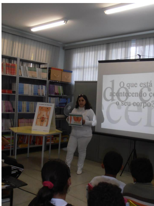
Figura 2: Palestra sobre Educação Sexual na escola do bairro.

Com o intuito de melhorar o nível de informação da população do bairro Jardim das Colinas de Itajubá a respeito do tema educação sexual, foi criada parceria com a escola de ensino fundamental presente no bairro. São realizadas palestras mensais, nas quais médica e enfermeira debatem sobre o tema com os alunos. Percebeu-se grande interesse por parte dos estudantes e observou-se que muitos desconheciam a anatomia do próprio corpo.