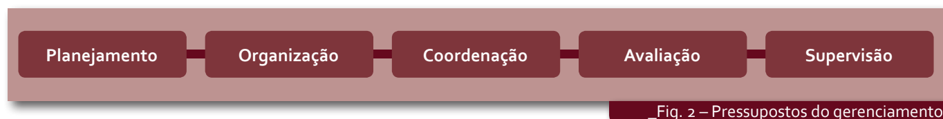
_Fig. 2 – Pressupostos do gerenciamento

Essa definição de procedimentos, princípios e ações gerenciais, atendimentos assistenciais e treinamentos de profissionais será acoplada aos princípios do SUS que produzirão, por sua vez, situações ligadas aos pressupostos do gerenciamento, ou seja: