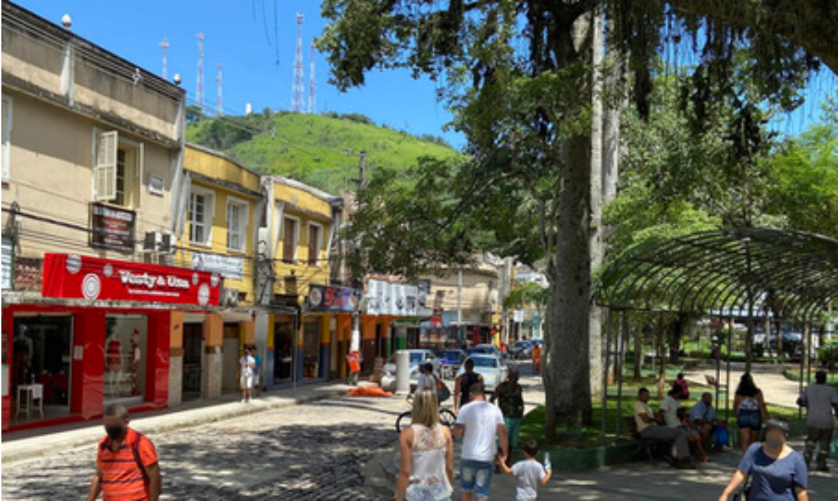
Figura 2 – Rua e praça em torno do centro de Piraí, com uma colina no fundo em que se observa algumas torres para emissão de sinais de rádio.

Servindo ambas as UBSs em dias alternados existem um médico, uma cirurgiã dentista, uma auxiliar de odonto, e uma enfermeira que também exerce a função de gerente. Há ainda funcionários fixos, que são dois agentes comunitários de saúde (ACS) e dois técnicos de enfermagem (TE) na UBS de Ribeirão das Lajes, e mais três ACSs, dois TEs, e uma secretária de recepção na UBS de Caiçara.