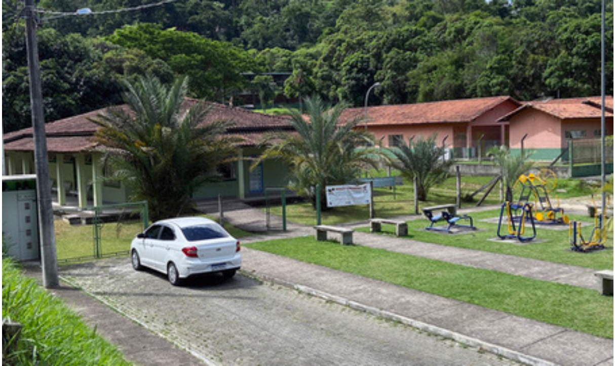
Figura 4 – UBS de Caiçara, com uma praça em frente e uma escola municipal ao lado.

No bairro de Caiçara, que é um pouco maior e mais populoso, já se observam algumas casas com tijolo à mostra em ruas sem asfalto adentrando a serra. Muitos ali trabalham vendendo frutas e mantimentos na rodovia, realizando serviços de capinagem, ou como motoristas de caminhão. Para chegar à UBS, uns dois terços dos moradores precisam de ônibus e ainda têm que atravessar, ou melhor, correr à pé, duas duplas de faixas em sentidos opostos da rodovia.