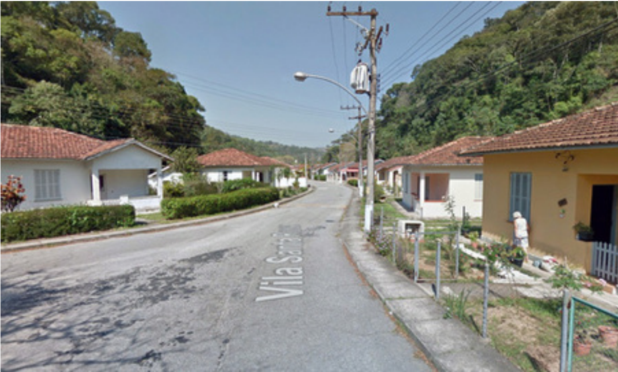
Figura 5 – Casas de arquitetura semelhante, espaçadas umas das outras, com driveway e garagem, caracterizam o bairro de Ribeirão das Lajes.

Quanto à escolaridade, 173 (8%) têm o nível superior completo e 653 (30%) têm o ensino médio completo. As ocupações ou formações mais declaradas são de eletricista, pedreiro, caseiro, professor de ensino fundamental, motorista de caminhão, atendente de mercado, e empregado doméstico. Quanto à cor de pele, é descrito pelos ACSs como havendo 1223 (56%) brancos, 691 (32%) pardos, e 253 (11%) negros. Outros dados bem interessantes é de que 258 (12%) moradores desconhecem o nome do pai ou da mãe, e de que apenas 404 (18%) têm plano de saúde privado.