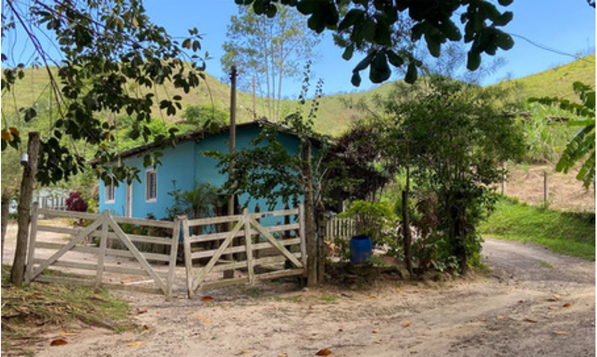
Figura 6 – Casas simples em ruas de chão que desbravam a mata, que nem sempre têm as paredes revestidas, caracterizam o bairro de Caiçara.

neoplasia maligna, 24 (1%) com acidente vascular encefálico prévio, 19 (1%) com infarto agudo do miocárdio prévio, 23 (1%) acamados ou domiciliados, e 3 (0,01%) com história de tuberculose em algum momento da vida.