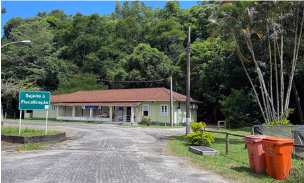
Figura 3 – UBS de Ribeirão das Lajes, que fica de frente para uma guarita e o portão de acesso principal à usina da Light.