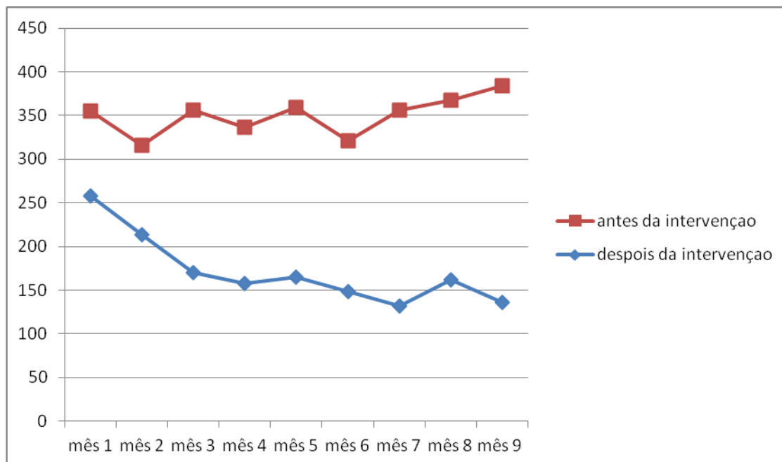
Grafico 1. Níveis da glicemia mediado grupo em jejum (mg/dl), antes e depois da intervenção.