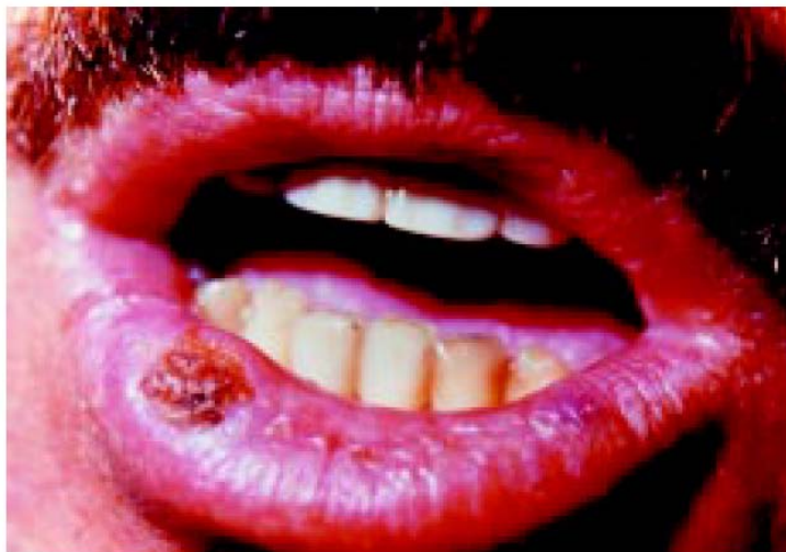
Carcinoma invasor de lábio