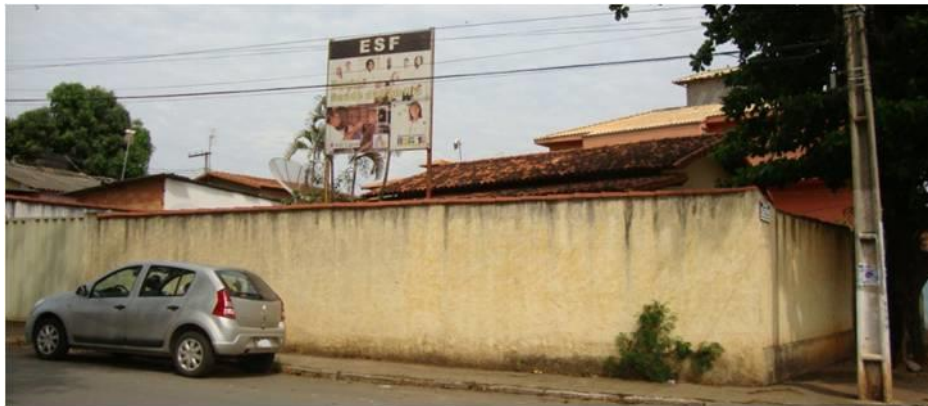
Figura 1- Unidade Básica de Saúde ESF Orozimbo Macedo.

A Estratégia Saúde da Família Orozimbo Macedo foi inaugurada em novembro de 2001, mas somente em março de 2002 foi estabelecido um local para as atividades. A ESF Orozimbo Macedo está instalada em uma casa antiga e adaptada para ser uma unidade de saúde (Figura 1), entretanto, sua área pode ser considerada inadequada, considerando-se a demanda e a população coberta. A ESF Orozimbo Macedo está situada a 1,5km do bairro de sua abrangência.