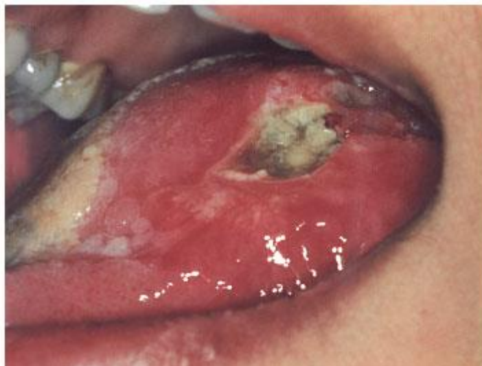
Figura 1: Carcinoma Epidermóide