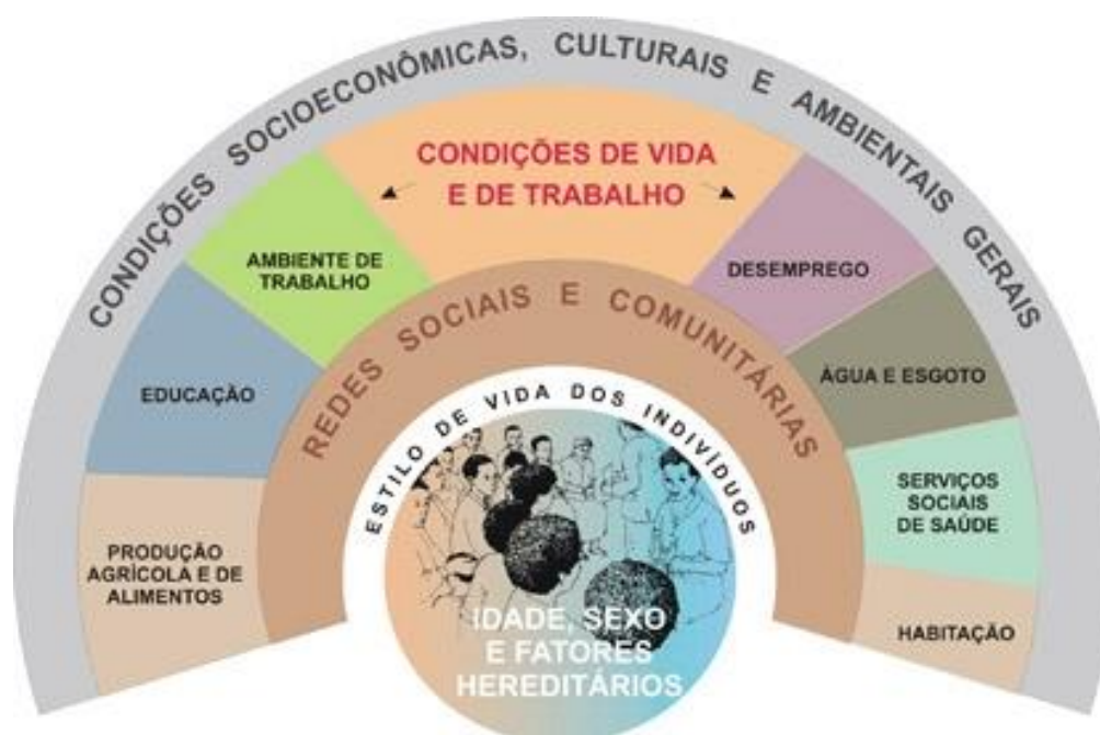
Figura 1- Modelo de determinação social da saúde proposto por Dahlgren e Whitehead.