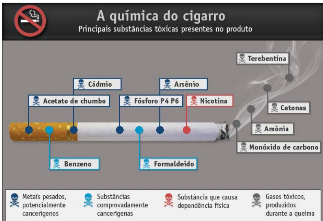
Figura 1: Substâncias químicas presentes na composição do cigarro

Além da nicotina, conforme Figura 1, há várias substâncias na composição do cigarro. No processo de queima do cigarro são produzidas 4.720 substâncias químicas em 15 funções, sendo que dessas substâncias, 60 apresentam atividade cancerígena, e outras são reconhecidamente tóxicas. Estão dentre elas: “monóxido de carbono e hidrocarbonetos aromáticos, citam-se amidas, imidas, ácidos carboxílicos, lactonas, ésteres, aldeídos, cetonas, álcoois, fenóis, aminas, nitritos, carboidratos, anidritos, metais pesados e substâncias radioativas com origem nos fertilizantes fosfatados” (BRASIL, 2011, p. 4).