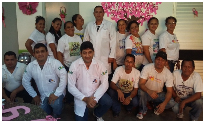
Figura 4: Equipe de saúde na UBS Eneidino Monteiro.

Ganhamos conhecimento e experiência, agora olhamos as pessoas idosas de forma diferente, e ficamos satisfeitos de vê-los alegres e felizes depois de receber carinho, respeito e atenção de todos nós. Muitos que foram atendidos na intervenção hoje se sentem mais satisfeitos com eles mesmos e com nosso trabalho, pois muitos deles foram reintegrado à sociedade, hoje tem uma vida útil e participativa, recebendo o carinho e amor de sua família.