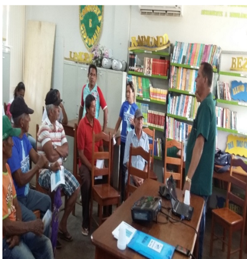
Figura 2: Realização de atividade de promoção da saúde com os idosos.