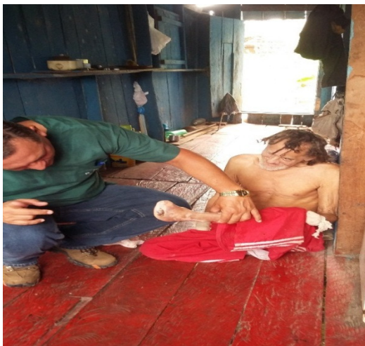
Figura 1: Atendimento domiciliar a usuário idoso com DM.