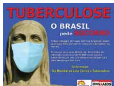
Figura 1: Dia mundial de luta contra a tuberculose

Quanto ao acompanhamento dos casos nas dependências da unidade de saúde, é preciso assegurar consultas agendadas mensalmente, e se houver falta por parte do paciente, o agente comunitário de saúde deve realizar a visita domiciliar para saber as razões de sua ausência e providenciar nova consulta. A interrupção ao tratamento pode complicar ainda mais o processo