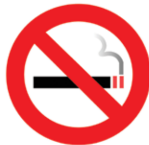
Figura 2: Tabagismo

A partir de 1996, o Brasil iniciou de maneira oficial, uma política para combater o tabagismo no país. Foi instituída a Lei Federal 9.496,