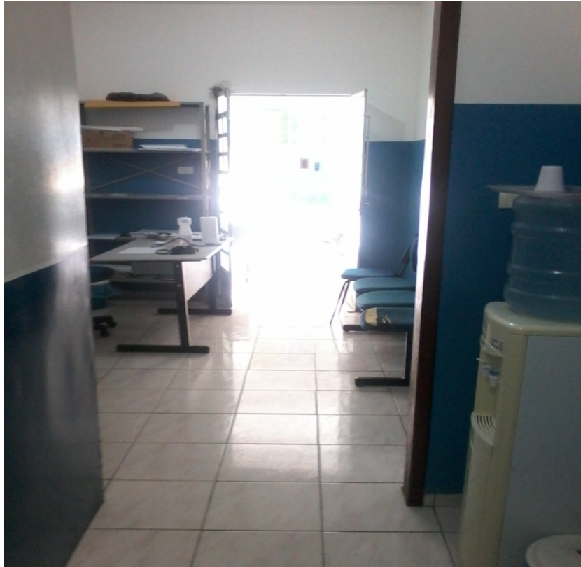
Figura 3 - Posto de saúde da comunidade Urbano 1(Mandacaru)