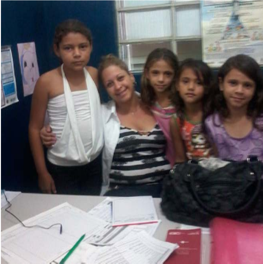
Figura 6 - Dia de trabalho ( Visita de alunos em pesquisa)