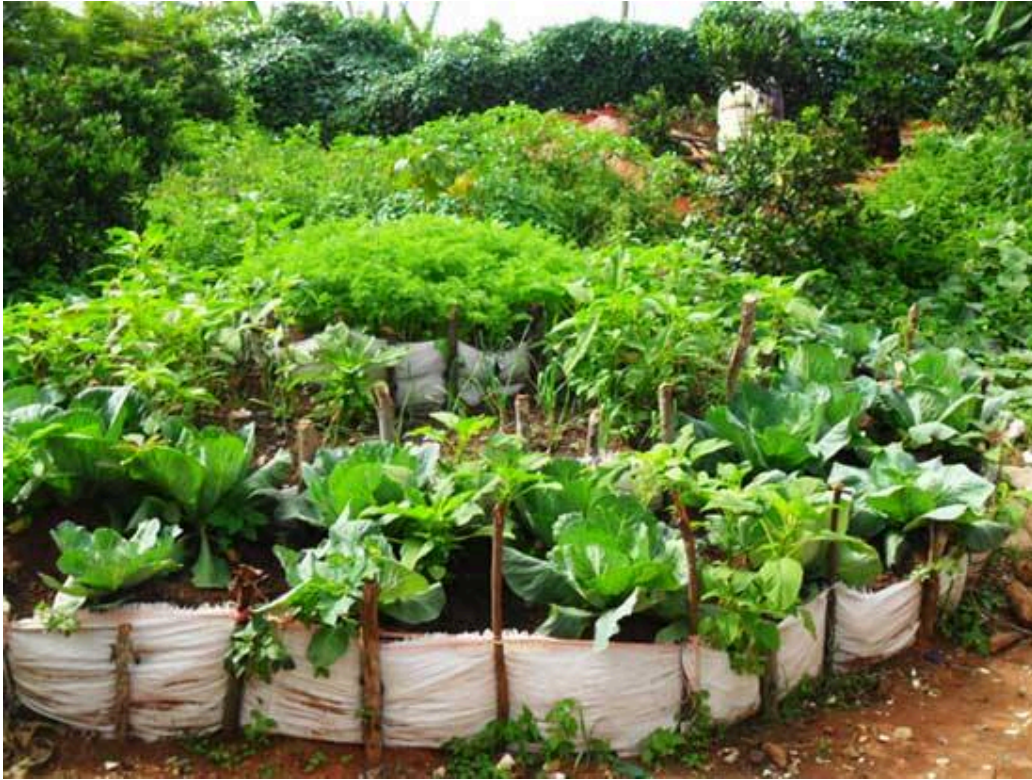
Figura 5 - Produtos orgânicos produzidos em Mata Grande.