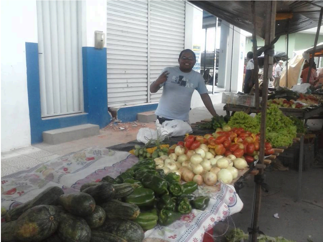
Figura 4 - Feira livre: Mata Grande